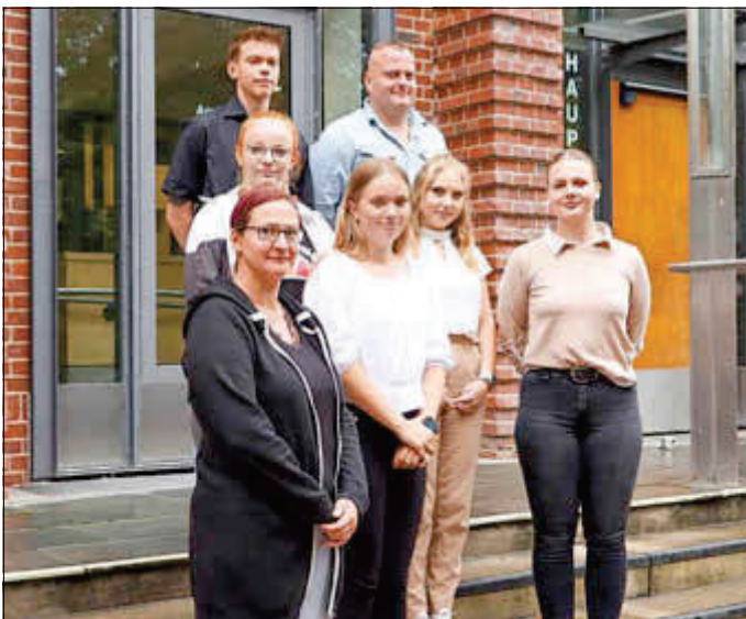
Azubibegrüßung und Absolventenverabschiedung

Gleichzeitig wurden die diesjährigen Absolventen feierlich in das Berufsleben aufgenommen, von denen die meisten der Diakonie Güstrow als Pflegefachkräfte erhalten bleiben.