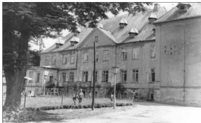
Außenstelle der Bezirksnervenklinik Schwerin in Dobbertin, Rückansicht Haus 16

Betroffene, deren Angehörige oder Betreuer können sich noch bis zum Meldeschluss am 30.06.2021 persönlich, telefonisch oder schriftlich per Brief, Mail oder Fax an die Anlauf- und Beratungsstelle Stiftung „Anerkennung und Hilfe“ wenden. Die Stiftung unterstützt Menschen, die als Kinder und Jugendliche in der DDR zwischen 1949 und 1990 in stationären Einrichtungen der Sonderpädagogik, Psychiatrie oder Behindertenhilfe Leid und Unrecht erfahren haben und heute noch unter den Folgen leiden. Die Anlauf- und Beratungsstelle wurde bei der Landesbeauftragten für MV für die Aufarbeitung der SED-Diktatur eingerichtet.