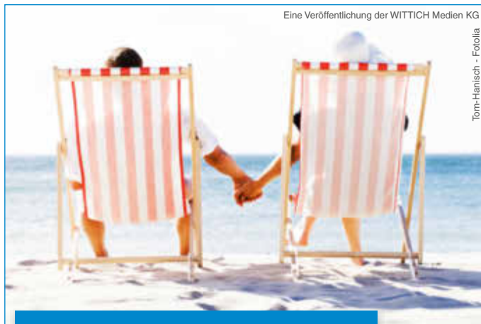
Eine Veröffentlichung der WITTICH Medien KG

LINUS WITTICH Lokal informiert. Druck. Internet. Mobil.