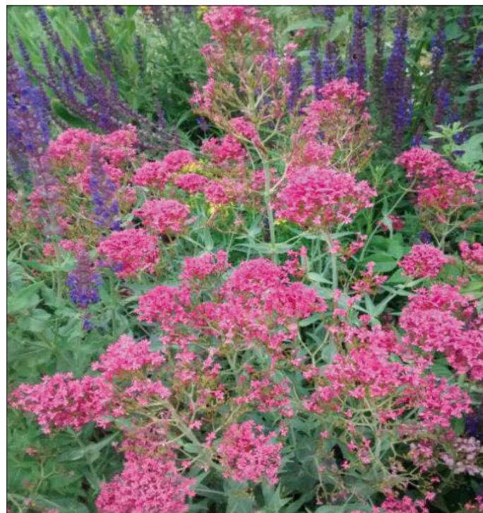
Die Spornblume ( Centranthus ruber ) samt gerne aus.

eine offene Wetterlage und ein strenger Winter ist nicht in Sicht. Daher sollten schon jetzt Pflanzen abgestochen und in Töpfe gesetzt werden, damit sie zum oben genannten Termin bereitstehen. Eine Beschriftung der Pflanzen wäre vorteilhaft. Vor Ort wird Angelika Elbracht aus Boldebeck fachkundige Unterstützung anbieten und auch Tipps zur Pflanzung und Pflege geben. Wir freuen uns auf eine rege Beteiligung.