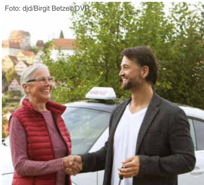
Zu einer Rückmeldefahrt gehören auch eine Vor- und eine Nachbesprechung.